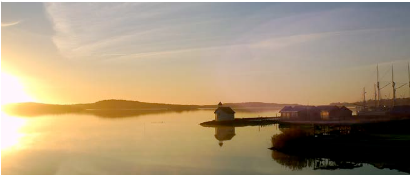
Vinterstemning Mariehamn på Åland. http://www.visitaland.com/se/fakta/mariehamn