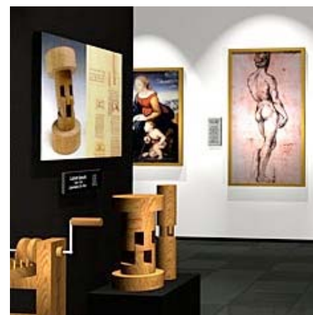
Leonardo da Vinci, Michelangelo och Rafael.

Utstilling i Göteborg viser tre odödliga mästare, og 19 av utstillingens totalt 55 originalverk är utförda av Leonardo da Vinci, Michelangelo och Rafael. Här finns även spännande modeller av ett flertal av Leonardos 500 år gamla uppfinningar, och du ser kopior av skulpturer, reproduktioner i stor skala av vägg- och takmålningar. :And There Was Light presenteras med hjälp av modern multimediateknik och tar dig med på en häpnadsväckande resa. http://www.and-there-was-light.com