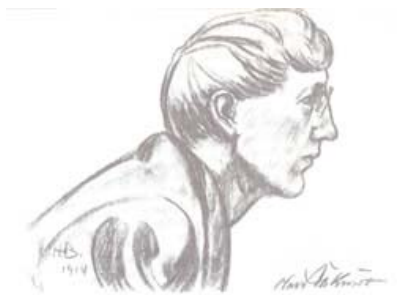
Olav Aukrust teikna av Halvard Blekastad http://www.aukrust-nordgard.no/hoved.php?sideid=7

ANTROPOSOFISK SELSKAP I NORGES KALENDER http://www.antroposofi.no/direkte/kalender