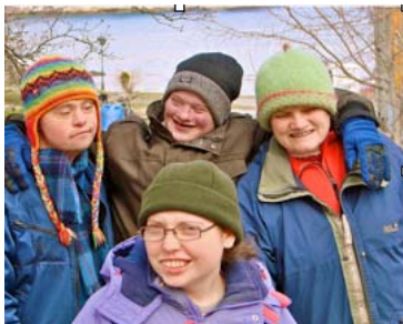
Ungdom på Framskolen, Vallersund.

Filmen är en dokumentär och en hyllning till bina ur ett kärleksfullt, livfullt och nytt perspektiv. Se trailer: http://www.rudolfsteiner-2011.com/index.php?set_language=en&ccpage=medlingen_detail&set_z_aktuelles=5