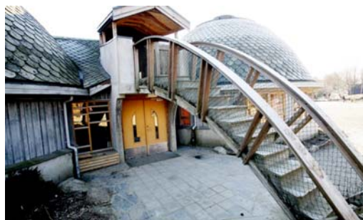
Steinerskolen i Stavanger.

Les Frode Barkveds omtale av Liv Laga; læreglede – levegledede.