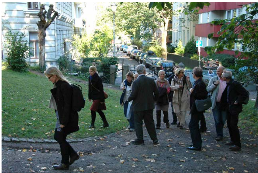
Etter besøket på Nobelinstituttet kunne de som ønsket bli med på en vandring langs det "Det antroposofiske kvartal bak Slottet" via Berle og Hjelms gate til Josefinesgate 12. http://www.antroposofi.no/fileadmin/ain/antroposofisk_kvartal.pdf