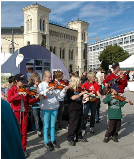
Populært når Solveien Spelemannslag spiller. De er tilknyttet Nordstrand Steinerskole http://www.nordstrand.steinerskolen.no