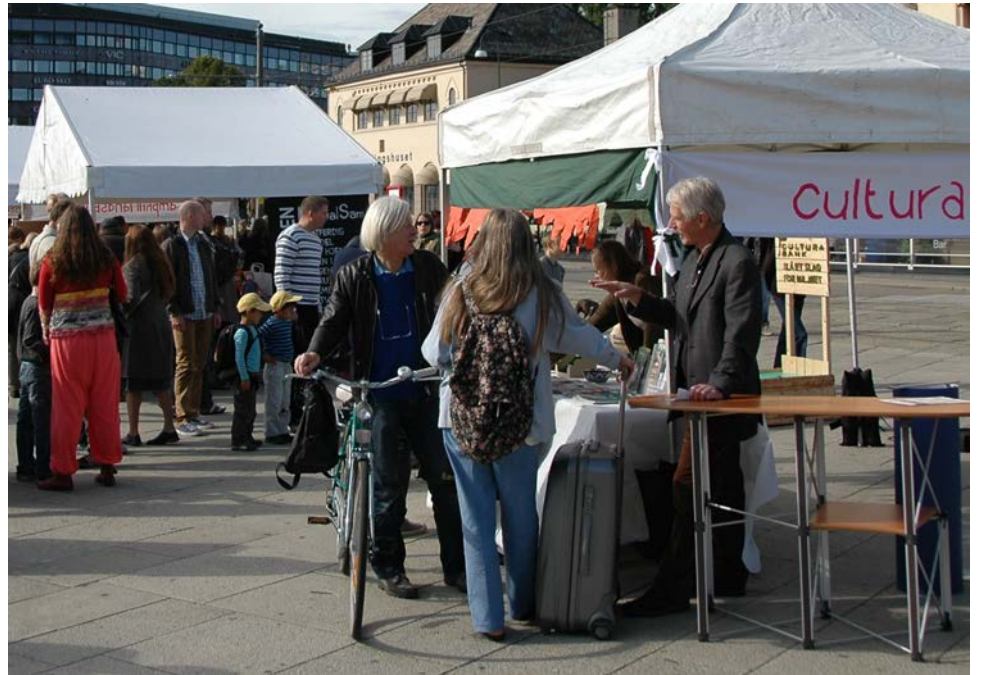
Cultura bank stilte med minigolf – slå et slag for miljøet http://www.cultura.no