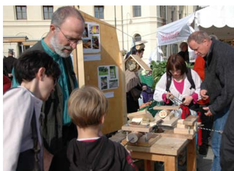
Prover verktøy fra Vidaråsen.