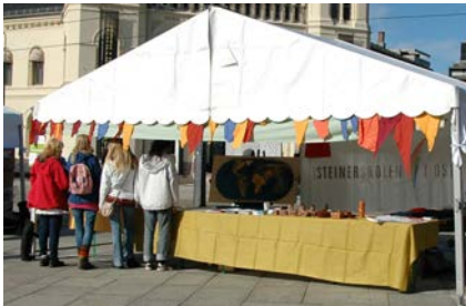
Rudolf Steinerskolen i Oslo, http://www.rsio.no/