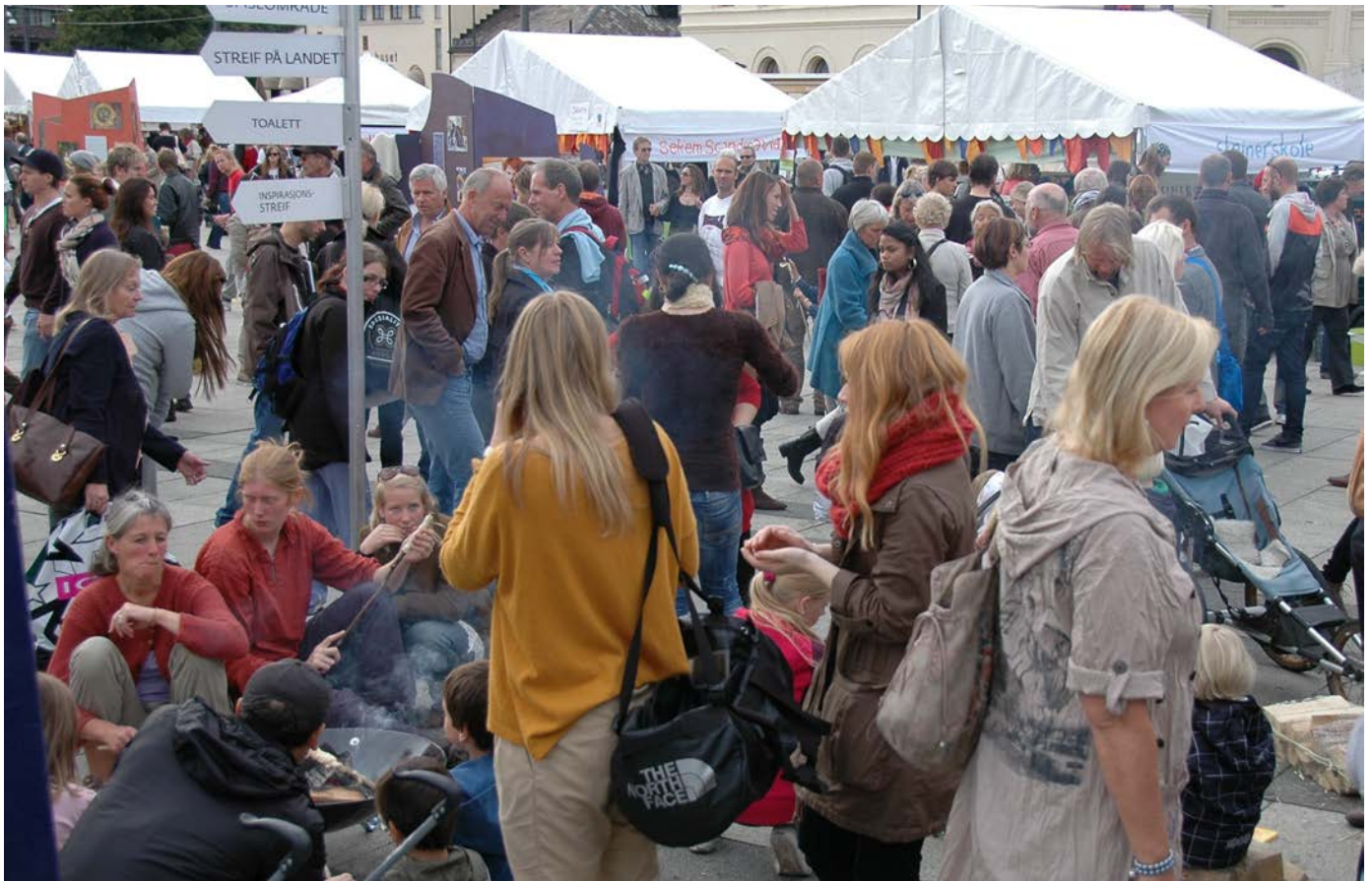
Steinerskoleforbundet http://www.steinerskolen.no/ stilte med studenter fra Rudolf Steinerhøyskolen – som grillet pinnebrød – en svært populær aktivitet. Se også Facebook: http://nb-no.facebook.com/pages/Steinerskoleforbundet-i-Norge/154887364553291