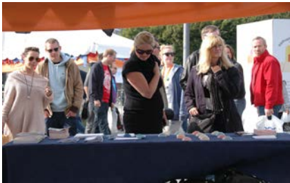
Hjerter fra UNGT INITIATIV - Norge/Norden http://www.facebook.com/pages/Nordic-Youth-Initiative/103691646372185