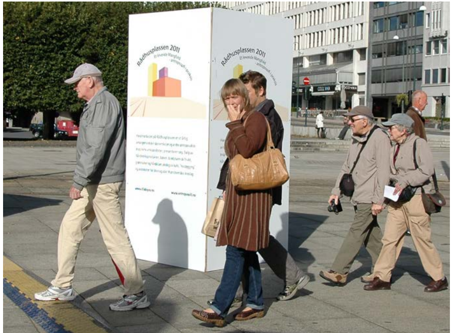
På full fart inn på høstmarked som i år foregikk samtidig med Matstreif.