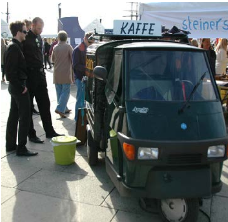
Green Bean http://www.greenbean.no serverte økologisk kaffe.

http://www.facebook.com/pages/Rådhusplassen-Antroposofi-i-praksis/145497655462096?v=wall