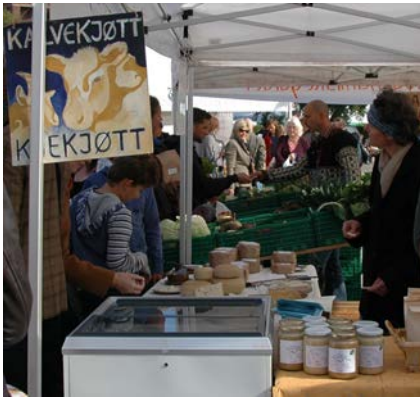
Ommang Søndre http://omvang-sondre.origo.no