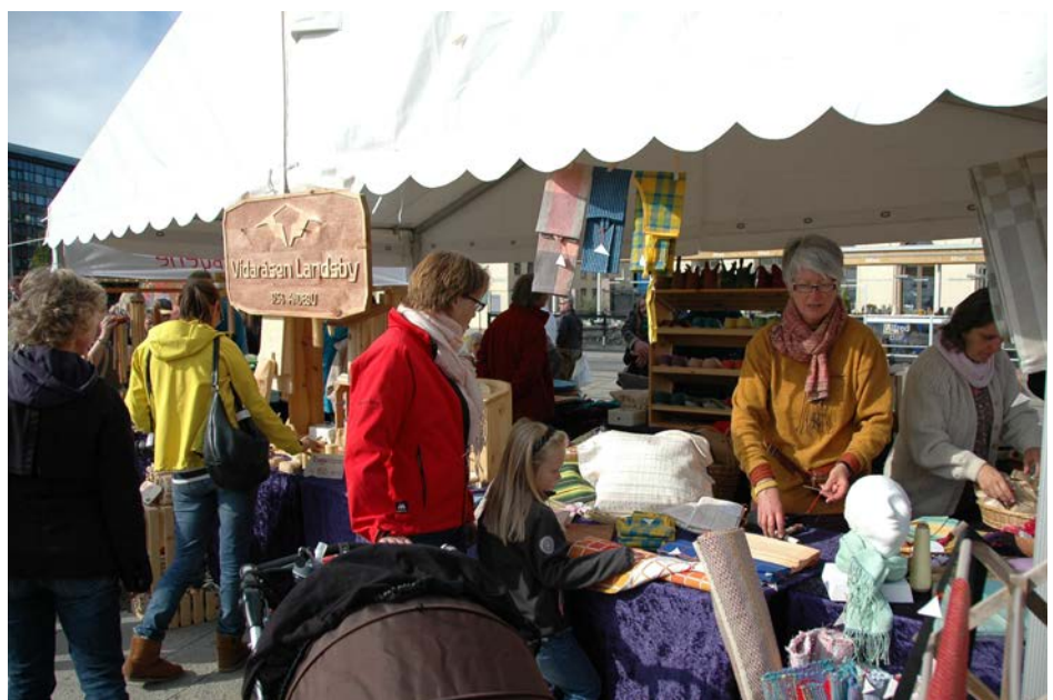
Vidaråsen Landsby, Andebu, http://vidarasen.camphill.no/