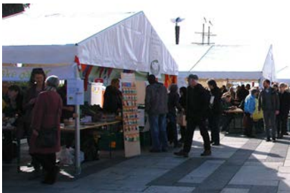
Solhatt økologiske frø http://solhatt.no