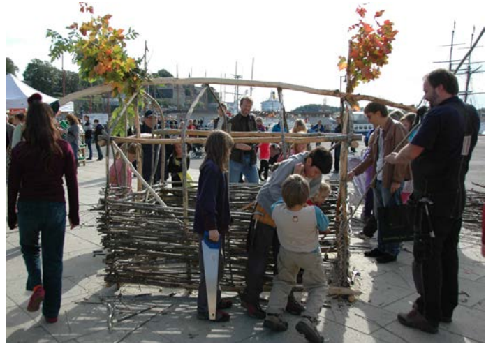
Ferske, unge, slanke rognetrær ble benyttet til flettingen.