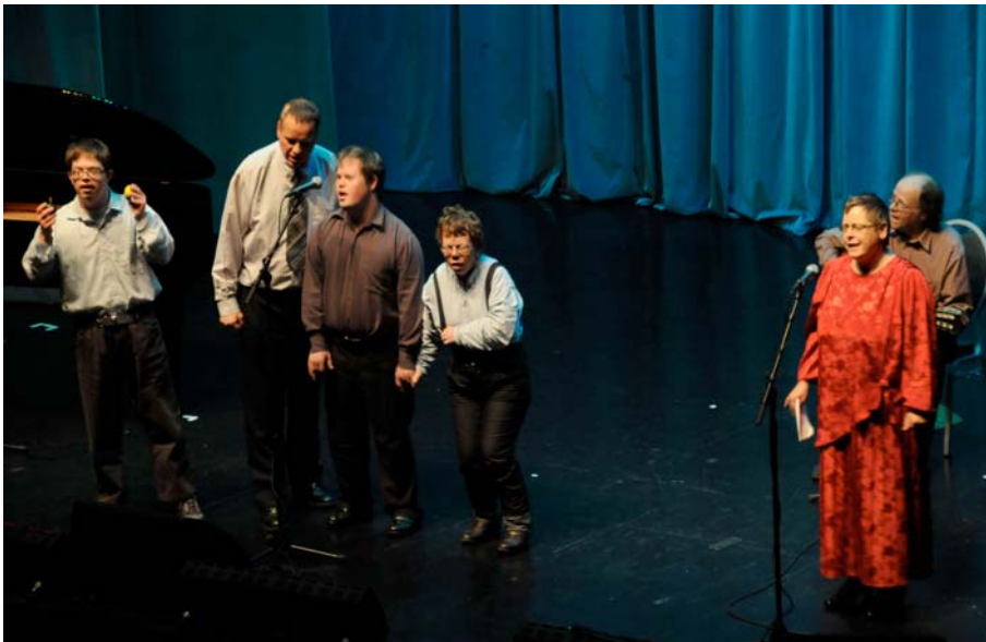
Landsbyboere fra Vidaråsen.