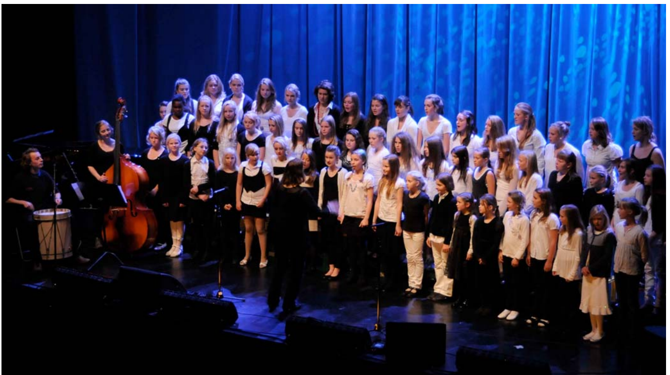
Steinerskolens Jentekor fra Rudolf Steinerskolen i Oslo på Hovseter