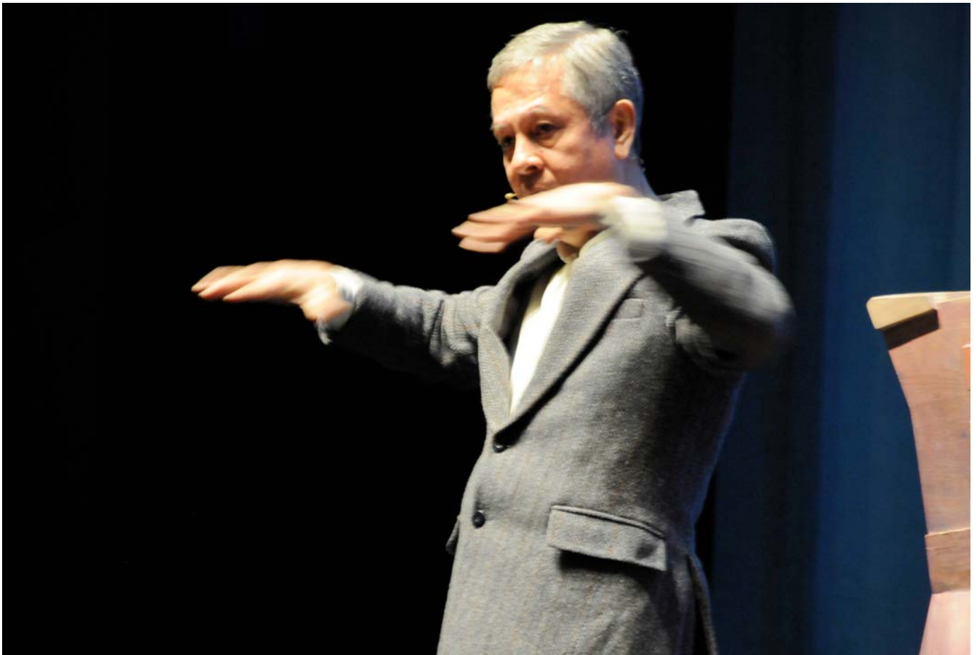
Hovedgjest under markeringen var den filippinske sivilsamfunnsaktivisten Nicanor Perlas.

http://www.antroposofi.no/fileadmin/ain/mennesket_i_verden_lite.pdf