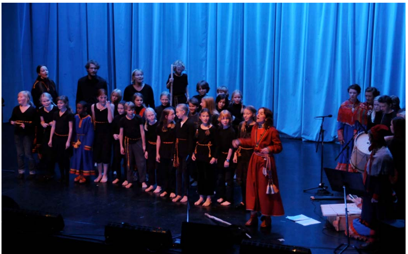
Elever fra Steinerskolene i Tromsø og Grav i Bærum.