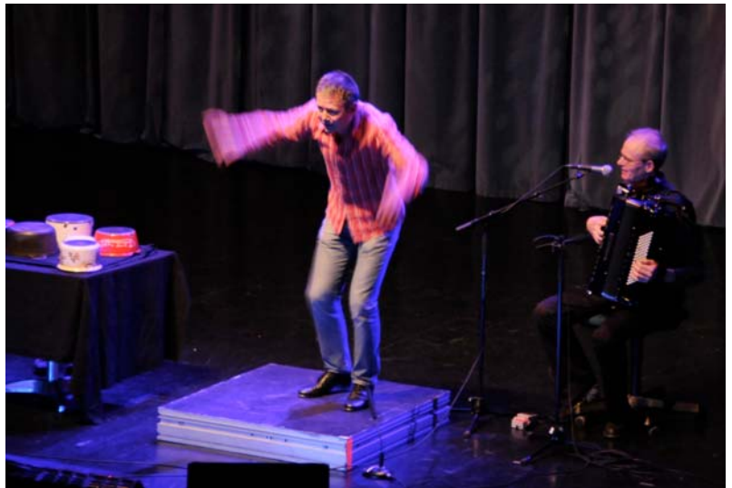
Fra Bergen kom Fliflet/Hamre.