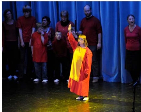
Helsepedagogisk Steinerskole i Oslo