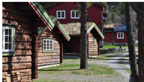
Rondane Gjestegård, Enden i Sollia.

25.6 Bjørnhollia. Morgensamling. Slutt og avreise ca kl 11.30.