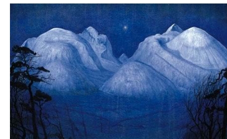
Vinternatt i Rondane, Harald Sohlberg, 1914.

I forkant av turen kan de som har anledning bli med til Nasjonalgalleriet i Oslo 22. april for å studere Harald Sohlbergs maleri. Oppmøte utenfor kl 11. Knut Dannevig vil da være med oss.