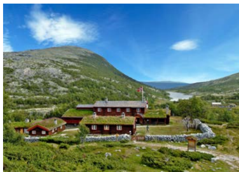
Bjørnhollia turisthytte (914 moh) er en gammel seter fra 1700-tallet.

http://www.nrk.no/nyheter/distrikt/hedmark_og_oppland/1.7937659