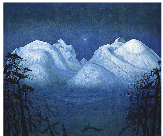
Vinternatt i Rondane (1914)