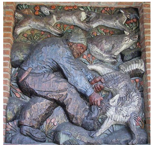
Vidar beseirer Fenrisulven

”Jo lenger vi kan trenge inn i den norrøne mytologis enkeltheter, desto tydeligere vil vi se at de største okkulte sannheter kommer til uttrykk på en fremragende måte i denne (norrøne) mytologiens bilder, noe som virkelig ikke er tilfelle i noen annen mytologi. (...) Idet Vidars skikkelse stråler mot oss fra Ragnarok, ser vi at det fra den norrøne mytologi lyser oss i møte et håp for fremtiden.”