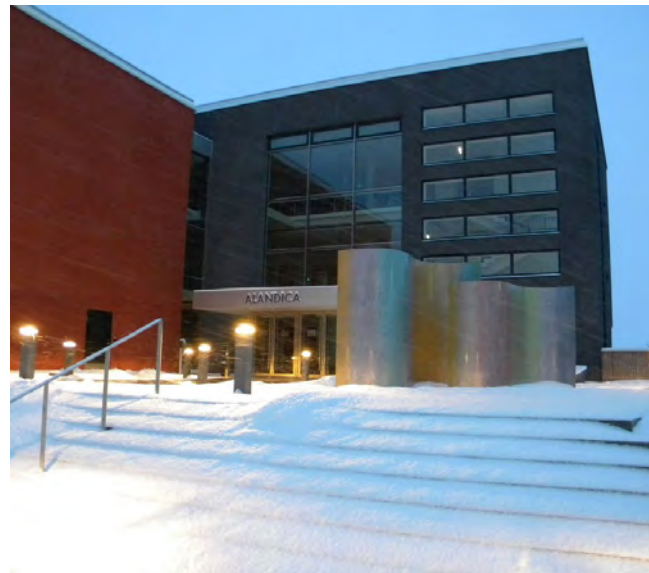
Alandica kulturhus i Mariehamn

Det er svært rimelig å reise til Åland med de store passasjerfergene som går i skytteltrafikk til Mariehamn fra Stockholm og Kapellskär i Sverige, og fra Helsingfors og Åbo i Finland. Du trenger ikke bestille plass hvis du ikke skal ha lugar. Eckerö-linjen går fra Grisslehamn til Eckerö på Åland. Skal du ta med bilen, må du å bestille bilplass i god tid. Fly til Åland er også mulig. Informasjon om de ulike overnattingsstedene og reise til Åland finnes på www.innerlight2011.com .