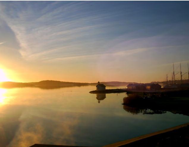
Kveldsstemming på Åland