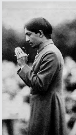
Jiddu Krishnamurti i Ommen 3. august 1929, i nærvær av Annie Besant, Charles W. Leadbeater og mer enn 3000 ordensmedlemmer.

Utdrag av Krishnamurtis tale ved oppløsningen av Sjerneordenen i Ommen (NL) 3. august 1929