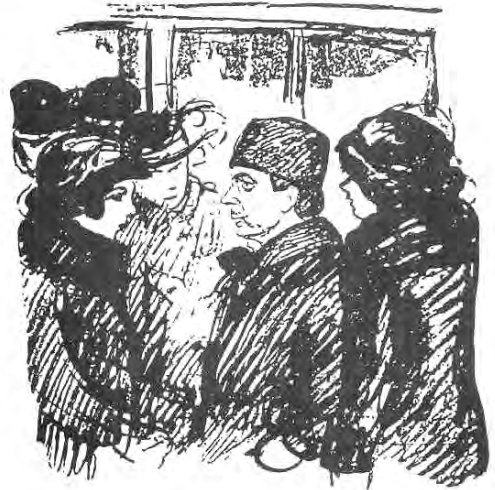
Tidens Tegn var tilstede på perrongen da Rudolf Steiner ankom hovedstaden høsten 1921.

heve oss opp til menneskehetens felleskapskarakter [...] og virke i hele menneskeutviklingens ånd», altså det motsatte av det som fører inn i det rasemessige, som «vi skal heve oss ut av». (S. 72.)