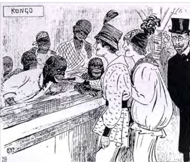
«Kongolandsby» på norsk i 1914