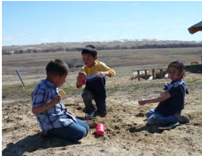
Lekende barn utenfor Lakota Waldorf School i Indianerreservatet i South Dakota, USA.

av at eurasiske bakterier hadde vandret fra stamme til stamme – før europeerne selv hadde satt seg fast i området. Og han understreker at den del av den indianske befolkningen som døde på grunn av de spanske conquistadorene er forsvinnende liten i forhold til de som døde på grunn av manglende resistens. 65