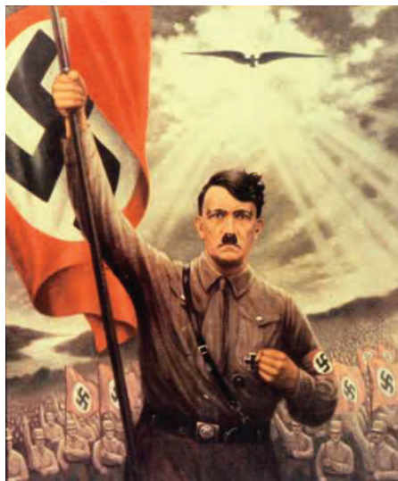
Adolf Hitler som «Messias»: propagandaplakat fra 1930-tallet

rundt Kristus-erfaringer i det 20. århundre. Steiner understreker her at det vil arbeide seg frem nye evner i menneskeheten som gjør det overflødig å følge dogmer, trossetninger og ytre dokumenter i forhold til Kristus. Mennesker – først noen få, deretter stadig flere – vil kunne ha en umiddelbar opplevelse av Kristus i det eteriske, som kan sammenlignes med Paulus' Damaskus-opplevelse. Han sier: «Idet