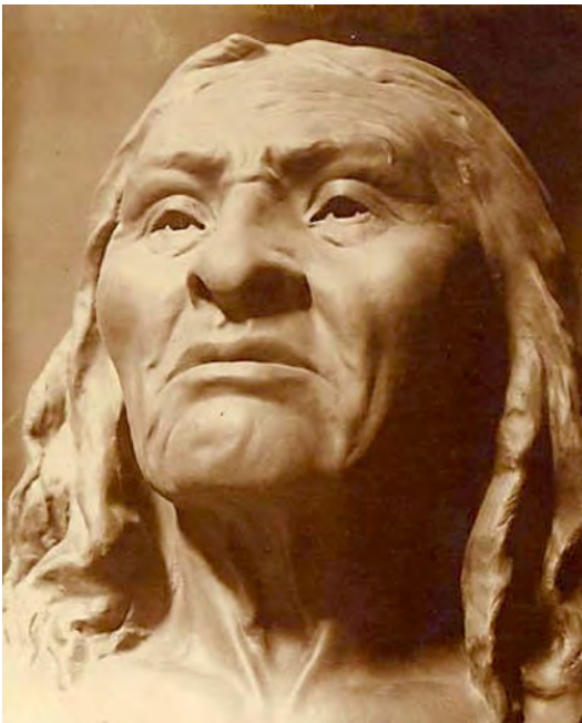
Høvding Seattle (1780-1866).

Her ser vi altså at den amerikanske urbefolkning representerer det folk som bringer rasedannelsen til en stillstand, til opphør. Det vil si at dette folket blir representanter også for det som fører avhengigheten av den fysiske differensieringen til et slutt punkt. Leser vi Steiner nøye her, så merker vi at han beskriver et folk han også kaller «den brune rasens sønn» som et folk som står nær ånden, nettopp fordi det er et gammelt, døende folk. «Hva var det største for indianeren?» spør han, og svarer selv: «Det var at han ennå kunne ane noe av den gamle storhet og herlighet fra en tidsalder som fantes i den gamle atlantiske tid. [...] Han har holdt fast ved Den store ånd fra den fjerne urtid.» (S. 102.)