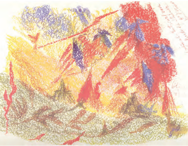
«Lemuria», pastellskisse av Rudolf Steiner for utsmykningen av den store kuppelen i det første Goetheanum.

i stadig, levende forvandling. Like fullt er det dette Steiner forsøker med sin åndsvitenskap.