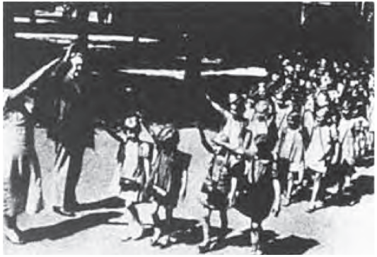
I 1934 ble Hitler-hilsen innført i alle tyske skoler.

om deres forhold til antroposofi og Antroposofisk Selskap.» (S. 56.)