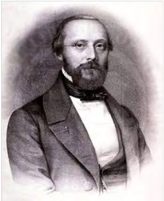
Rudolf Ludwig Karl Virchow (1821-1902), tysk lege, blir regnet som pioner innen patologien og grunnlegger av sosialmedisinen. I en landsomfattende undersøkelse som gikk på å finne fysiske kjennetegn på tyske og jødiske barn konkluderte han med at det ikke fantes en ren tysk eller jødisk rase. (Kilde: http://no.wikipedia.org/wiki/Rudolf_Virchow .)

Rudolf Wirchow og hans resultater ble marginalisert. Han hadde nemlig gjennom grundige studier konstatert at det ikke fantes signifikante forskjeller mellom jødiske og tyske barn: «Diskusjonen om eksistensen av en «ren rase» det være seg tysk eller jødisk, kunne dermed ha blitt avsluttet. [...] Men Wirchow ble uthengt som «slave av jødedommen» og «en del av den jødiske verdenssammensvergelsen.» (S. 16-17)