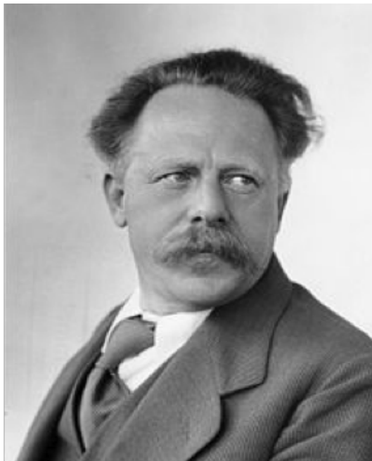
Jakob Wilhelm Hauer (1881-1962) var professor i religionsvitenskap og en av Rudolf Steiners argeste motstandere. Han ble brukt av nazilederne som fagperson når det gjaldt antroposofi. Han prøvde å grunnlegge en ny og egen religion inspirert av hinduismen, som han håpet skulle bli Det Tredje Rikes folkereligion. Hauer tilhørte Völkisch-bevegelsen. (Kilde: http://en.wikipedia.org/wiki/Jakob_Wilhelm_Hauer .)

fra 1921 ble trykket i et nytt opplag i 2004, og utgiverne anbefaler boken for «intetanende foreldre» som ønsker å sende sine barn på Waldorfskolen uten «å være informert om denne skoles okkulte bakgrunn.» (S. 33)